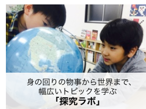
身の回りの物事から世界まで、幅広いトピックを学ぶ「探究ラボ」