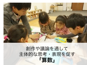
創作や議論を通して主体的な思考・表現を促す「算数」

※ その他私立高等（適性検査型ではない） 一般的な受験対策は他塾をご検討ください